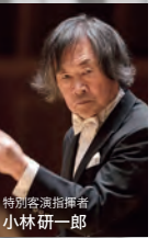
特別客演指揮者 小林 研一郎