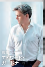
指揮 エドワード・ ガードナー