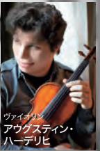
ヴァイオリン アウグスティン・ ハーデリヒ