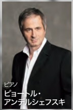
ピアノ ピョートル・ アンデルシェフスキ