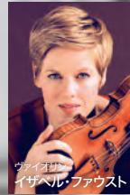
ヴァイオリン イザベル・ファウスト