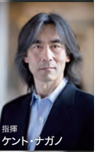
指揮 ケント・ナガノ