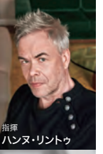
指揮 ハンヌ・リントウ