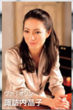
ヴァイオリン 諏訪内 凧子