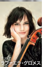
ピアノ ラファエラ・グロメス