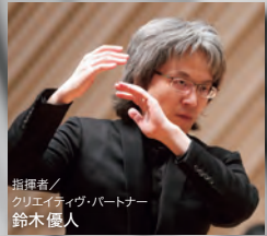
指揮者/ クリエイティブ・パートナー 鈴木優人