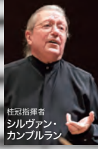
桂冠指揮者 シルヴァン・ カンブララン