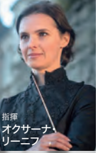
指揮 オクサーナ・ リーニフ