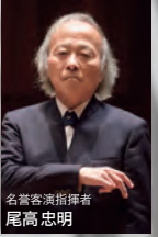
名誉客演指揮者 尾高 忠明