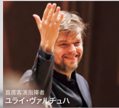
首席客演指揮者 ユライ・ヴァルチュハ