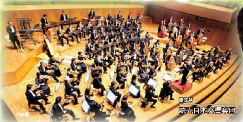
管弦楽 読売日本交響楽団