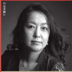
アルト:池田香織 Kaori IKEDA:Alto

ニュージーランド国立響首席客演指揮者、大阪フィル首席指揮者、新日本フィル、京都市響、オーケストラ・アンサンブル金沢音楽監督を歴任。2017年7月、大阪国際フェスティバルにて「バーンスタイン：ミサ」を自身23年ぶりに総監督（演出・指揮）として率い、壮大で唯一無二な舞台を作り上げたと各方面にて非常に高い評価を受けた。2016年「渡邊暁雄基金特別賞」、「東燃ゼネラル音楽賞」、2018年「大阪文化賞」「大阪文化祭賞」「音楽クリティック・クラブ賞」をトリプル受賞。自宅にアヒルを飼って、いる。 オフィシャルサイト http://www.michiyoshi-inoue.com/