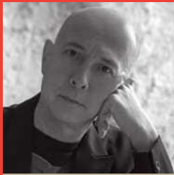
指揮:井上道義 Michiyoshi INOUE:Conductor