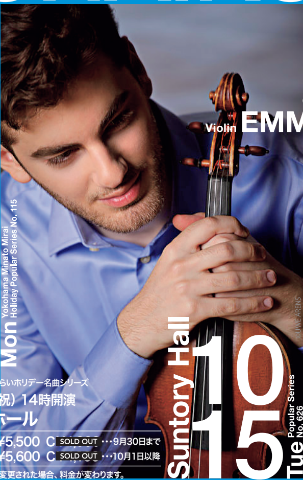
Yokohama Minato Mirai Holiday Popular Series No. 115

読響名誉指揮者 ユーリ・テミルカーノフ ヴァイオリン エマニュエル・チェクナヴォリアン