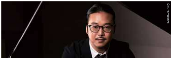
ピアノ:反田恭平 Kyohei Sorita, Piano

1985年生まれ若き才能。パリ国立高等音楽院にてフランソワ・グザヴィエ・ロトに師事。2014年フランス人として初めてのネスレ・ザルツブルク音楽祭ヤング・コンダクターズ・アワード受賞をきっかけに、欧州で活躍。先進的な現代音楽演奏グループ「ル・バルコン」の創設者として、幅広いレパートリーで音楽と最先端の音響・照明システムを融合させた活動を展開。「ナクソス島のアリアドネ」や「月に憑かれたピエロ」で好評を博したほか、昨シーズンからはフィルハーモニー・ド・パリでのシュトゥックハウゼン・オペラ・ツィクルス「光」の7年間プロジェクトをスタートさせている。BBCプロムス、デンマーク国立管、RAI国立管、レ・シエクル、トゥールーズ・キャピトル国立管、ミュンヘン・フィル、グスタフ・マーラー・ユゲント管等主要楽団への客演のほか、ミラノ・スカラ座やパリ・オペラ座、ベルリン国立歌劇場にも招聘されている。