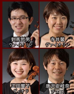
對馬哲男 ヴァイオリン