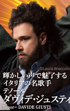
輝かしい声で魅了する イタリアの名歌手 テノール ダヴィデ・ジュステイ Tenor= DAVIDE GIUSTI