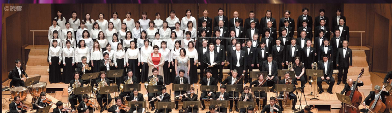
合唱 新国立劇場合唱団 Chorus= New National Theatre Chorus