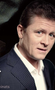
バイロイト音楽祭で 活躍する世界的名匠 バス エギルス・シリンス Bass= EGILS SILINS