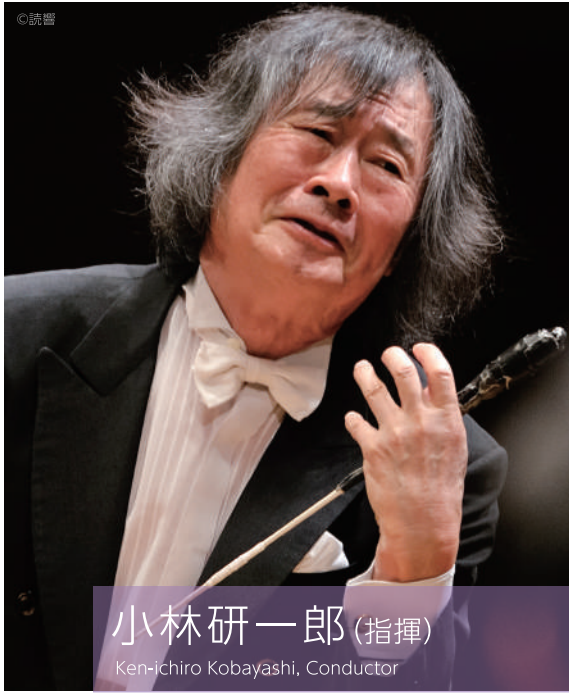
小林研一郎 (指揮) Ken-ichiro Kobayashi, Conductor